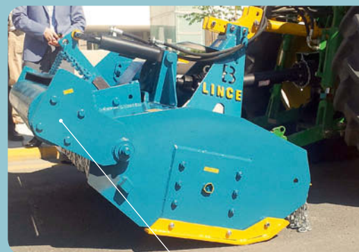
Rulo trasero hidráulico